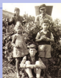
Weinlese mit der ganzen Familie