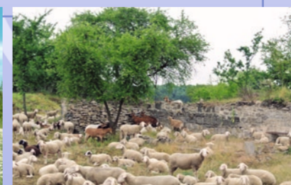
Schafherde am Steinbruch