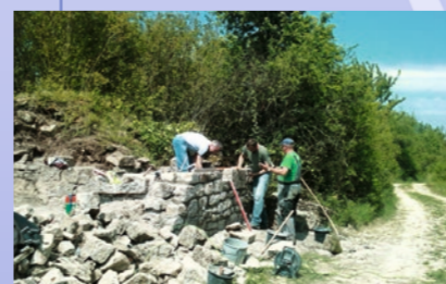
Ehrenamtliche aus Goßmannsdorf und Winterhausen haben 2011 bis 2013 die alten Gebäudereste gesichert.

Bis in das 20. Jahrhundert wurden die Grasflächen am Eichenleitberg für die Beweidung genutzt, dann begann man mit dem Abbau von Muschelkalk. Bis in die 1930er Jahre erfolgte der Abbau durch Steinbrucharbeiter, denen ein Werkzeugschuppen und ein Aufenthaltsraum zur Verfügung stand. Nach dem 2. Weltkrieg ersetzten mehr und mehr Maschinen die Steinbrucharbeiter. Nachdem die Steinbrucharbeiten aufgegeben wurden, hält ein Schäfer seit 1985 die Landschaft am Eichenleitberg offen. Seit 2013 werden die zugewachsenen Flächen durch Entbuschung im Rahmen des Naturprojekts Main-Muschelkalkweg gepflegt. Darüber informiert ein eigener Muschelkalkweg.