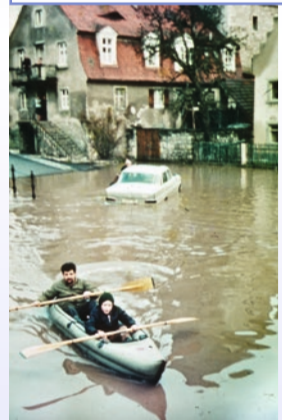
Hochwasser von 1970 und Hochwassermarken

Kein Bereich von Winterhausen war im Laufe der Jahrhunderte so großen Veränderungen ausgesetzt wie das direkt am Main gelegene alte Zentrum mit Pfarrkirche, Pfarrhaus und Schulhaus. Bis in die Mitte des 15. Jahrhunderts gab es ein von einer Mauer umgebenes hohenlohisches bzw. limpurgisches Winterhausen und außerhalb am Main um den heutigen Mauritiusplatz ein bischöfliches Winterhausen mit Kirche, Pfarrhaus und Schule, das 1463 wegen der ständigen Hochwasser aufgegeben wurde. Mit dem Bau der Brücke 1897 kam die nächste große Veränderung: Die Brückenstraße wurde zur neuen Verkehrsachse mit Aufschüttung für die Brückenauffahrt und Zollstation. Nach dem Bombardement 1945 ist davon nur der Brückenkopf als Aussichtspunkt übriggeblieben.