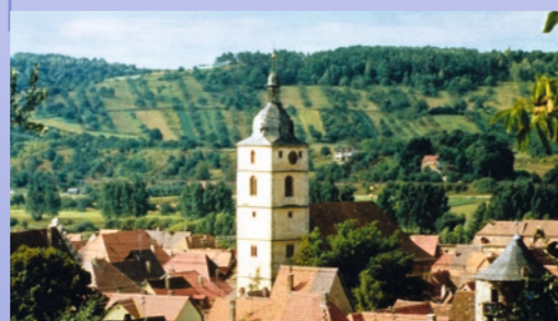
Blick von Sommerhausen auf die Würfelleite

Die Info-Tafel steht am Schnittpunkt von Rebflächen, Obstkulturen, Magerrasen und Wald. Bis in das 19. Jahrhundert hat der Weinbau in Winterhausen eine große Rolle gespielt, ging aber dann nicht zuletzt durch Rebrankheiten und die Reblaus zurück. Im 19. Jahrhundert wurde dann der Obstbau staatlich gefördert, sodass entlang der Wege auf ehemaligen Rebflächen Obstbäume gepflanzt wurden. Die Flächen oberhalb davon wurden von der Bevölkerung lange Zeit als Schafweide genutzt, ab 1905 aber schließlich mit Lärchen und Schwarzkiefern aufgeforstet. Heute wird ein Streifen zur Erhaltung der ökologisch wertvollen Magerrasen, die ursprünglich durch die Schafweide entstanden waren, entbuscht und einmal jährlich gemäht. 2003 wurde auf der Würfelleite der Winterhäuser Mondweg als Panoramaweg angelegt, für den eine Gruppe Freizeitbildhauer Skulpturen zum Thema Mond geschaffen haben. Diese begegnen dem Wanderer entlang des Weges.