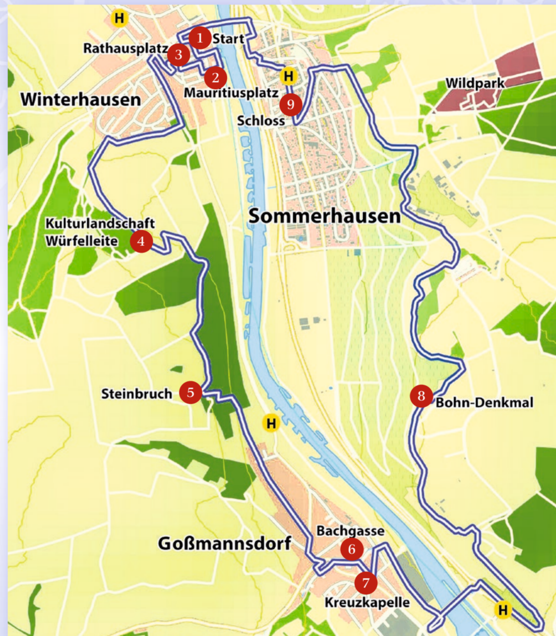
Weglänge: 14 km