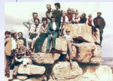
Bohn-Denkmal am Panoramaweg um 1970

Am östlichen Hang des Mains beginnt der bis zu 280 m hoch gelegene Ochsenfurter Gau, an dessen Rand der Sommerhäuser Panoramaweg verläuft. An den Hängen gedeiht auf dem von einer sandig-lehmigen Schicht überdeckten Muschelkalk der Sommerhäuser Wein. Dass der Weinbau in Sommerhausen eine wichtige Rolle spielt, davon zeugt nicht nur die Kulturlandschaft um den Ort, sondern auch die von der Sonne beschiene Trauben im Ortswappen. Entlang des Weges fallen die vielen Steinbrüche auf, in denen der Muschelkalk abgebaut wurde und wird. Zu Beginn finden wir auf Kleinochsenfurter Gemarkung ein Geotop mit einer Infotafel.