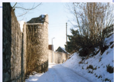
Goßmannsdorf ist vollständig von einer Mauer umgeben.