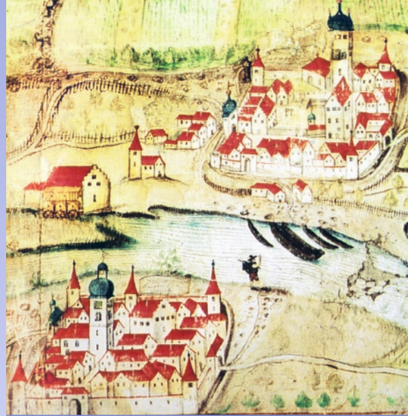
Winterhausen und Sommerhausen im Jahre 1604

Von Winterhausen führt der Kulturweg am Westhang oberhalb des Mains bis Goßmannsdorf. Auf dem Rückweg begleitet der Panoramaweg am Osthang den Wanderer bis nach Sommerhausen.