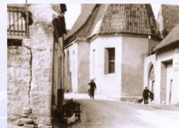
Kreuzkapelle um 1935

Die seit 1451 nachweisbare gotische Kreuzkapelle gehört seit 1907 zum Besitz der Kirchenstiftung Goßmannsdorf. Ab dem 16. Jahrhundert sind jüdische Einwohner in Goßmannsdorf nachweisbar. 1765 wurde eine Synagoge errichtet. Das Gebäude steht gegenüber der Kreuzkapelle. Vermutlich ab dem 14. Jahrhundert erfolgte eine Befestigung des Ortes mit einer Mauer, Gräben, Torhäusern und Türmen. Die Ringmauer war von einem Graben umgeben, der geflutet werden konnte. Ende des 19. Jahrhunderts wurden die drei Torhäuser abgebrochen und mehrere Durchbrüche in der Ringmauer genehmigt.