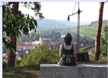
Blick vom Sommerhäuser terroir f auf den Ort